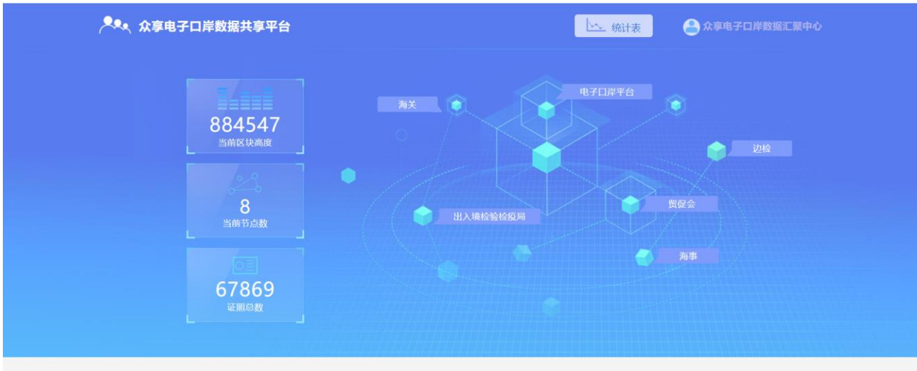
图 3-1 首页图