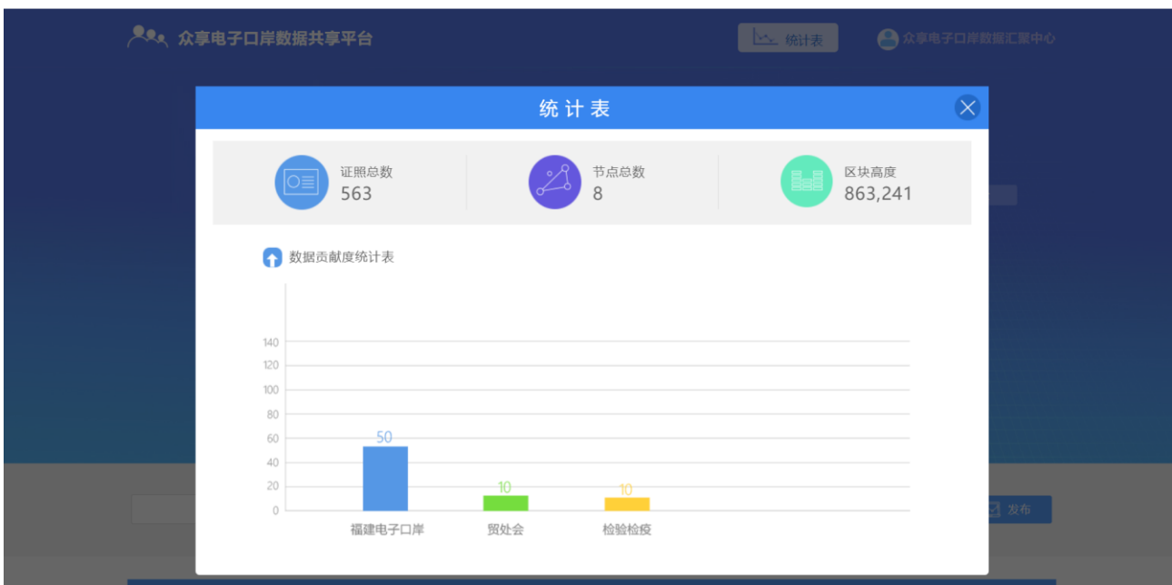
图 3-2 统计表